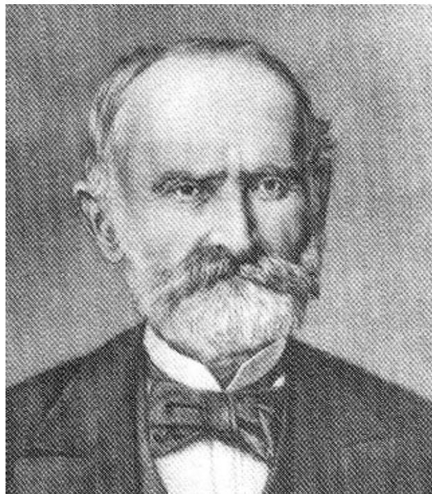
Слика 6. Др Јосиф Панчић (1814–1888).

Др Јосиф Панчић, који убрзо заузима његово место, рођен је 1814. у Угринима код Бирбира, испод Велебита, у хрватској приморској породици (слика 6).