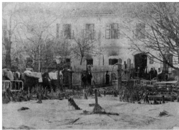
Слика 7. Прва стална Окружна болница у Крагујевцу погођена поплавом из Јасенице 1910. (изгорела у пожару 1918).